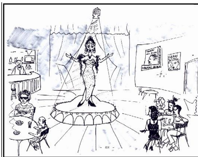
Ilustraciones originales del autor para la edición de la obra en 1996

( A la niña ) Siéntate con nosotras, Andrómeda, y deja a tu hermana un ratito con la Archi. ( La niña se integra perfectamente en el grupo )